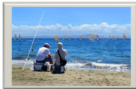
令和3年 観光写真展 市長賞作品《憩いの夏の海》

入 賞 ①観光写真の部 ・横須賀市長賞 1点 盾・商品券(1万円) ・横須賀市観光協会長賞 1点 盾・商品券(5千円) ・北下浦観光協会長賞 1点 盾・商品券(5千円) ・入選 5点 商品券 (2千円) ②みんなの写真の部 ・北下浦観光協会長賞 1点 盾・商品券(5千円) ・小・中学生の部 4点 商品券 (2千円分) ・入選 5点 商品券 (1千円)