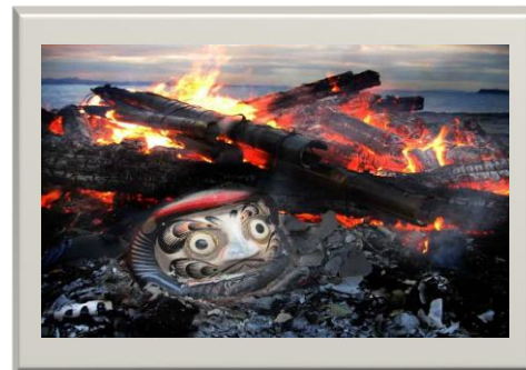
令和3年 みんなの写真展 北下浦観光協会長賞作品《おんべのダルマ》

応募の注意 1. 作品は未発表のものに限ります。 2. 作品の裏面に応募票(画題・住所・氏名・電話番号)を貼付してください。 3. みんなの写真展への応募は1人2点までとします。 4. 応募作品は返却しません。 5. 入賞作品は、主催者が広報活動などに優先的に使用する権利を保有することとし、CDを後日提出いただきます。 6. 被写体が人物で、その肖像権について問題が発生した場合、応募者自身の責任により対処していただき、主催者はその責任を負いません。