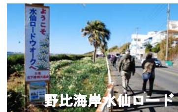
野比海岸水仙ロード